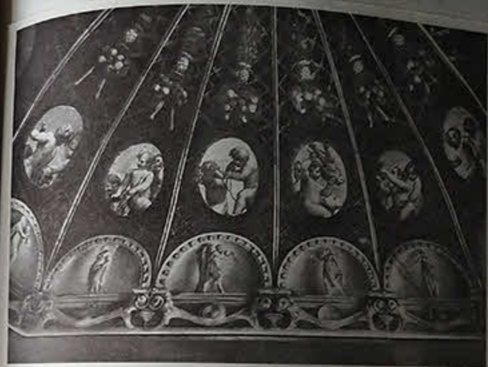
Корреджо. Ресница св. Павла в базилике Сан-Паоло-Величе.