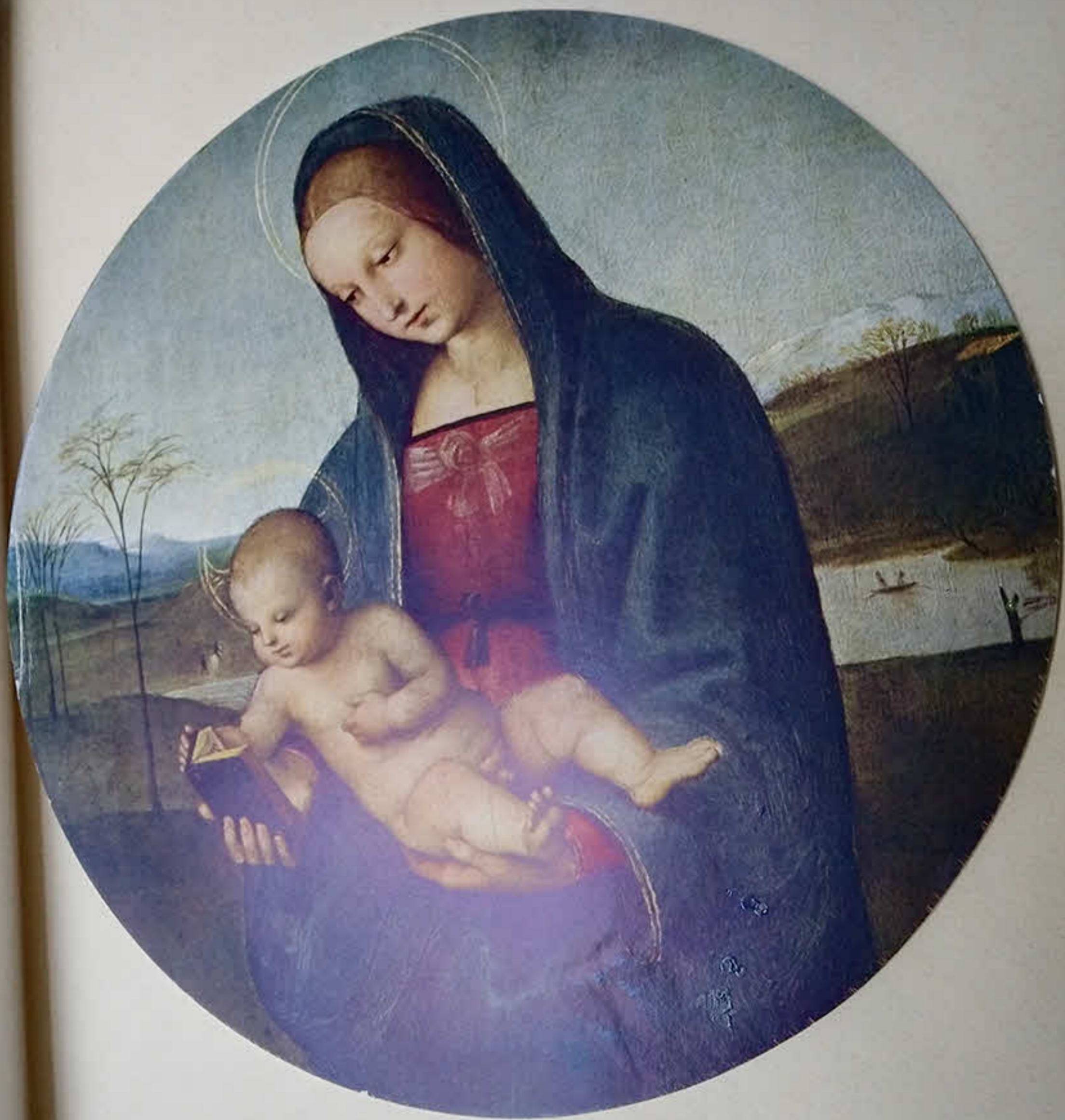
РАФАЭЛЬ МАДОННА КОНЕСТАБИЛЕ ИМПЕРАТОРСКОЙ ЭРМИТАЖЪ