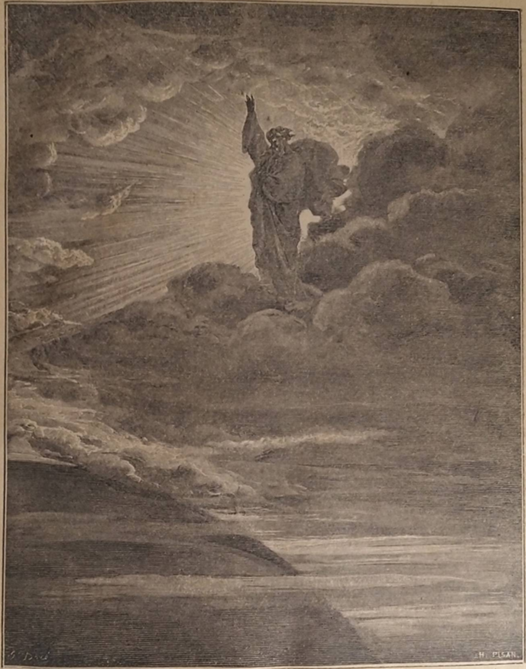
И сказалъ Богъ: да будетъ свѣтъ. (Быт. 1. 1, ст. 3).