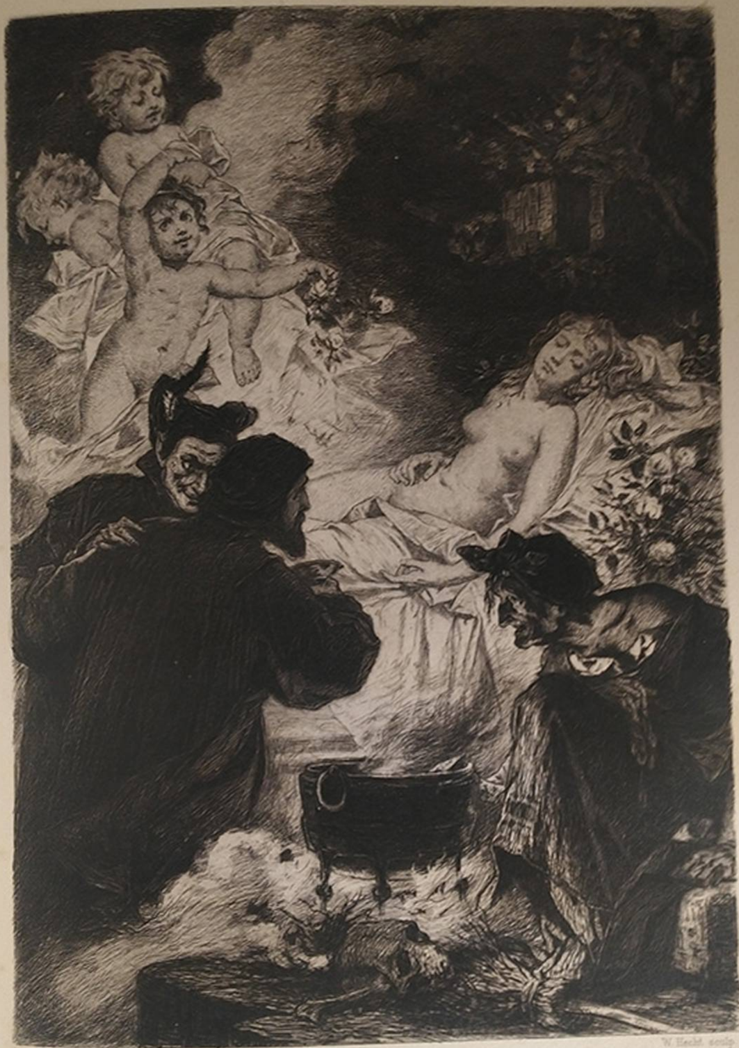
A. Lorenz Mayer del.